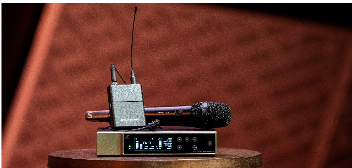
Evolution Wireless Digital ofrece conexión inalámbrica fácil y controlada por aplicaciones.

Los transmisores digitales inalámbricos Evolution cuentan con un rango dinámico de entrada de 134 dB, cinco veces más que los 120 dB habituales, lo que le permite captar cualquier cosa, desde un susurro muy suave hasta un motor a reacción a 45 metros de distancia. Tomando prestada tecnología de las principales series Digital 6000 y Digital 9000 de Sennheiser, EW-D no genera ningún producto de intermodulación significativo, por lo que se pueden acomodar más canales en una ventana de frecuencia determinada. Los sistemas tienen especificaciones excepcionales en cada detalle, ya sea una baja latencia de 1.9 milisegundos y una duración de la batería del transmisor de hasta 12 horas con el paquete de baterías recargables BA 70, o el ancho de banda de 56 MHz con hasta 90 canales por banda, que facilita la búsqueda de espacio incluso en entornos de RF muy concurridos.